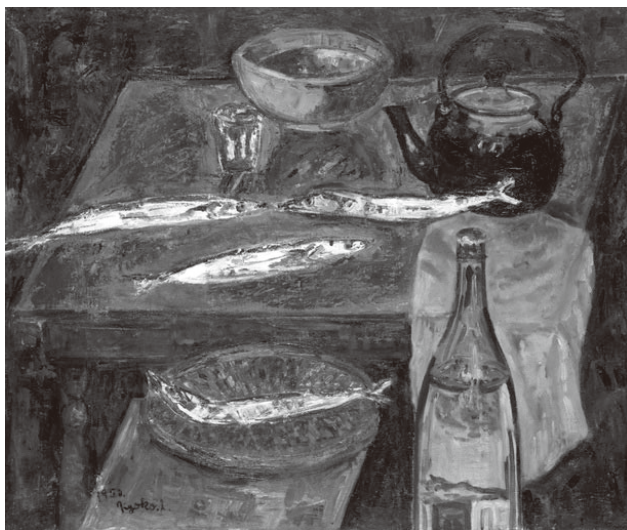
fig.3 《さんま》 1952年／油彩、キャンバス、60.6×72.8cm、 平塚市美術館蔵

長屋は山口出身で、旧長州藩に関係のある家柄だったと記憶しています。無口な人でした。新宿区角筈3丁目（現・西新宿）のガスタンク裏にあった消防署の隣にアトリエを、新宿駅西口に新宿絵画研究所を構えていました。私は共立入学直後から週4～5回程研究所に通っていました。研究所には校舎が近かったため