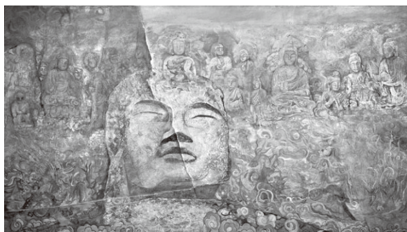
fig.10 《磨崖仏賛 I》 1978年／油彩、キャンバス、170.0×300.0cm、 平塚市美術館蔵