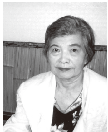
fig.1 平野杏子氏近影(2015年9月)

1930年神奈川県伊勢原市出身。本名は京子 [2] 。大久保作次郎、長屋勇、三岸節子に師事。油彩のほか版画、彫刻も手掛ける。旺玄会、新世紀美術協会への出品を経て無所属。国内の女性画家で結成された潮展に創立時(1969年)から参加。サロン・ド・メ展への招待出品(1980年他)、ヘンリー・ムーア大賞展での美ヶ原高原美術館賞受賞(1987年)等国内外で活躍している。韓国南山での仏蹟調査の実績は韓国でも高い評価を受けている。(fig.1)