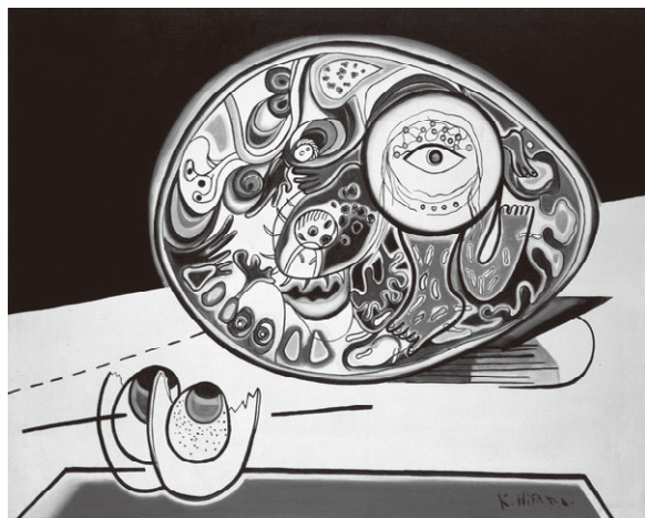
fig.7 <触手のある暦> 1965年/油彩、キャンバス、80.5×100.0cm、 平塚市美術館蔵