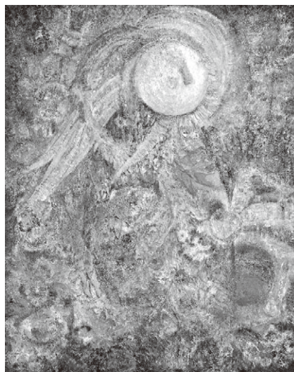
fig.8 <思念の刻印> 1967年/油彩、キャンバス、 65.2×50.0cm