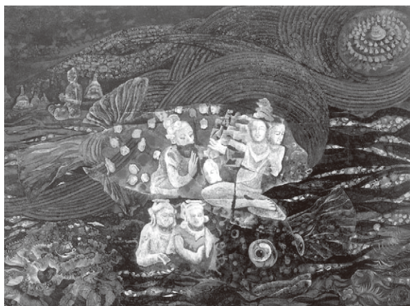
fig.9 《ボロブドールの善財童子》 1974年／油彩、キャンバス、193.9×259.1cm

1969年3月に美術評論家の竹田道太郎(1906-1997)とともにイタリア・フランスを巡るツアーに向かう途中飛行機が故障し、カルカッタ(コルカタ)に急遽着陸したため、偶然インドに3日間滞在することになりました。タージ・マハルを訪れたり、庶民の暮らしを見たりする等たいへん貴重な経験でした。この時は仏教に関する史跡や土地は訪れていませんが、ホテルで目にした密教画に惹きつけられました。また1969年6月に出会った韓国の新聞記者・金夫妻に招待され翌70年に初めて韓国を訪れました。その際導かれるように慶州・南山の磨崖仏を知り、その後9年間も磨崖仏の研究にのめり込みました [19] 。後年になると私の関心は宗教以前のシャーマニズム—自然と共生する先史時代が有する“美德”へと移っていきます。今思うと磨崖仏は山中の岩肌に仏像が彫られ、自然と人々の精神・信仰との融合が具現化したものだったことも、当時とりつかれた大きな理由だったのでしょう。1973年にはインドネシアの仏教遺跡ボロブドゥールを訪ね、翌年はインドを再訪しました。いずれも仏教の源流に近づきたい思いからでした。この時の取材をもと