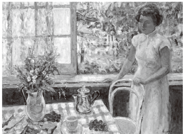
fig.4 《窓辺》 1952年／油彩、キャンバス、97.0×130.3cm

1949年に北川桃雄を中心につくられた「椿会」という集まりがありました。宮本三郎(1905-1974)や大久保作次郎ら共立の教員をはじめ、詩人で文芸評論家の野田宇太郎(1909-1984)や写真家の入江泰吉(1905-1992)等、様々な分野の文化人が集っていました [13] 。長屋邸も椿会の会場になることがあり、私もその隅に加わったことがあります。美術や文芸等の語らい、陶器の品