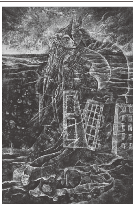
fig.11 《冠を流したオフエリア》 1970年／油彩、キャンバス、 145.5×97.0cm、 横浜美術館蔵

作品に目を向けると、星崎孝之助の指導を受けた1965年を挟んだ前年の《輪廻の章Ⅲ》（1961年、fig.6）《触手のある暦》（1965年、fig.7）と、後年の《冠を流したオフエリア》（1970年、fig.11）や《ボロブドールの善財童子》（1974年、fig.9）とでは印象がかなり異なる。前2作品では平野も指摘するように、後年も登場する卵や目等のモチーフが描かれるものの全体の構成はまだ簡素で余白もあり、色彩も原色が多い。対する後