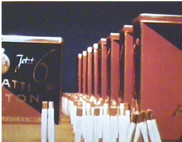
[PL.3] オスカー・フィッシングー 『ムラッティの行進!』(1934)