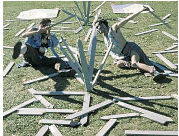
[PL.4] ノーマン・マクラレン 『お隣りさん』(1952)