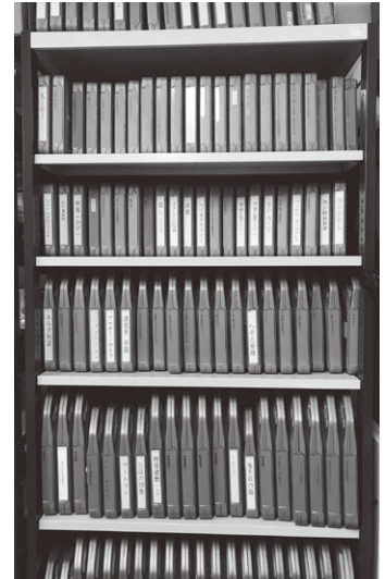
fig.1 16ミリ映像作品の保管状態

コレクションにはまた、いわゆるアート・アニメーションの作品も多く含まれる。オスカー・フィッシーガー [PL.3] (p.7) やレン・ライといったパイオニアから、ピンスクリーンという