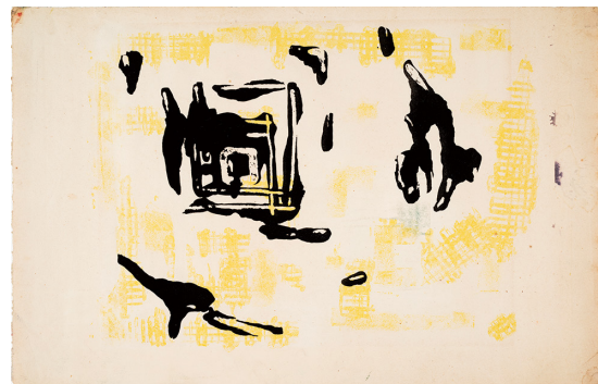
長谷川三郎《無題》1954年 紙、リトグラフ、33.5×51.2cm、 ディア&マーク・ワッツ・コレクション