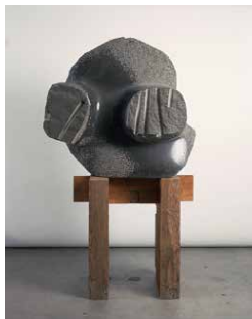
イサム・ノグチ《捜す者、捜し出したり》1969年 玄武岩、94.0×100.3×49.8cm、 イサム・ノグチ財団・庭園美術館（ニューヨーク）蔵

本展はニューヨークのイサム・ノグチ財団・庭園美術館と横浜美術館の共同企画です。出品の大部分は横浜会期終了後、ノグチ美術館（ニューヨーク）、アジア美術館（サンフランシスコ）で巡回展示されます。