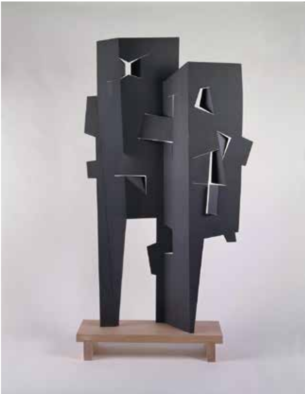
イサム・ノグチ《能楽師たち》1958年 アルミニウム、塗装、178.4×99.1×19.7cm イサム・ノグチ財団・庭園美術館（ニューヨーク）蔵