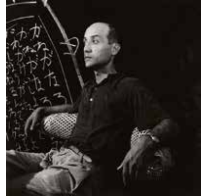
イサム・ノグチ、1950年