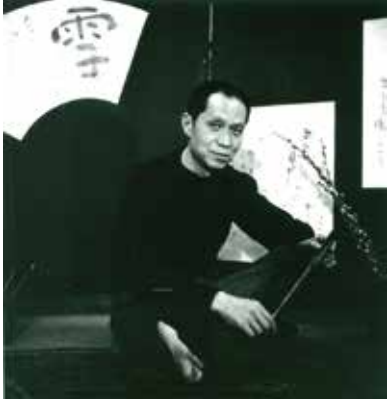
長谷川三郎、1956年頃

画家長谷川三郎は1906年山口県豊浦郡（現・下関市）に生まれる。青年期を芦屋で過ごし、甲南高等学校在学中には小出楯重 こいでなるしげ の下に通い油彩画を学ぶ。東京帝国大学に進学し、美術史を専攻。卒業論文では雪舟を論じた。