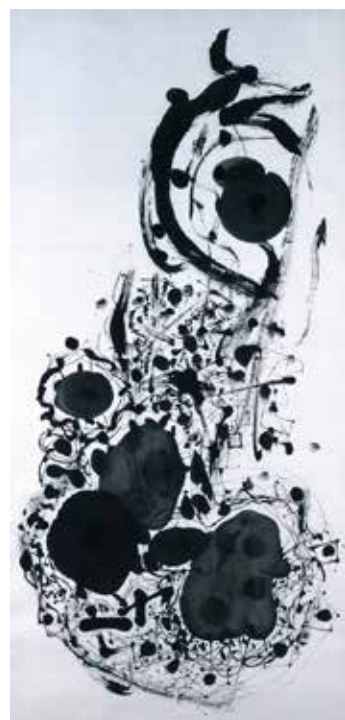
長谷川三郎《無題》1954年 紙本墨、138.8×70.0cm、 学校法人甲南学園 長谷川三郎記念ギャラリー蔵

また、1950年代にノグチがアメリカと日本を往復しながら制作した陶、石、アルミニウム、鉄、鐘青銅、バルサ材による彫刻、数々の「あかり」などの作品には、ノグチが長谷川とともに日本で見た古い文化遺産や、長谷川との対話を通して深めた禅や東洋思想への理解が本質となって現れていると言えます。小さな陶の《顔皿》から等身大を超えるアルミ板の《雪舟》、哲学的なタイトルをもつバルサ材の《死すべき運命》、そして高さ2.6mの石彫《庭の要素》まで、素材も規模も様々な作品群は、スタイルや表層的な日本趣味とは異次元の、時代や文化の違いを超えた世界美術に向けたノグチの挑戦といえるでしょう。今日わたしたちが抱くノグチ芸術のイメージの基本はこの時期に形作られたといっても過言ではありません。