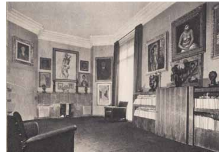
フォッシュ通りのギヨーム邸宅の様子（1932年頃）

オランジュリー美術館所蔵品の核をなす「ジャン・ヴァルテル&ポール・ギヨーム コレクション」は、ヨーロッパの中で最も質の高い印象派とエコール・ド・パリの作品群のひとつ。