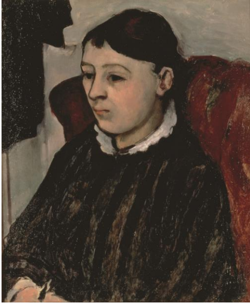
【序章出品作品】 ポール・セザンヌ 《縞模様の服を着たセザンヌ夫人》 1883-85年 油彩、カンヴァス 56.8×47.0cm