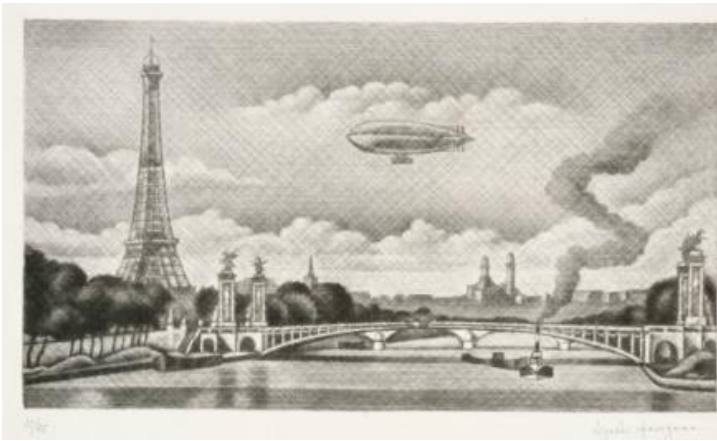
【第2章出品作品】 長谷川潔 《アレキサンドル三世橋とフランスの飛行船》 1930年 メゾチント 16.8×30.1cm