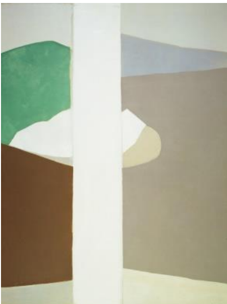
【第7章出品作品】 岡田謙三 《垂直》 1964年 油彩、カンヴァス 265.8×198.4cm