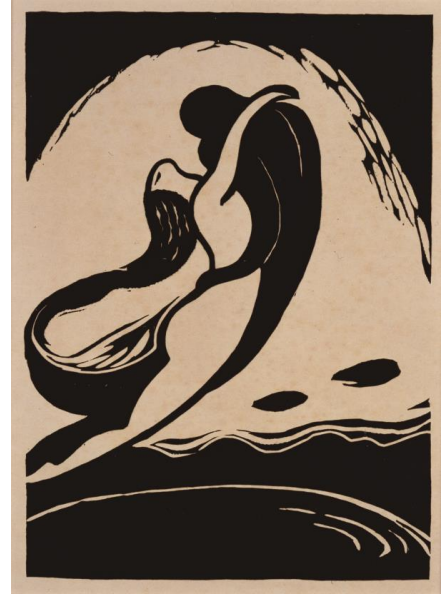
【第2章出品作品】 長谷川潔 《風（イェーツの詩に寄す）》 1915年 木版 37.0×26.3cm