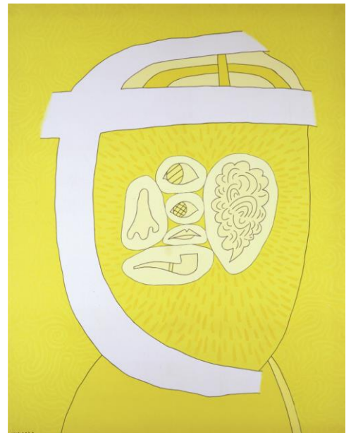
【第10章出品作品】 岡本信治郎 《耳のない肖像》 1968年 アクリル絵具、カンヴァス 228.0×182.0cm