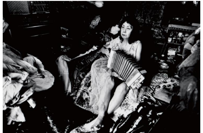
【第6章出品作品】 常盤とよ子 《追想》 1969年(1988年プリント) ゼラチン・シルバー・プリント 33.3×49.8cm