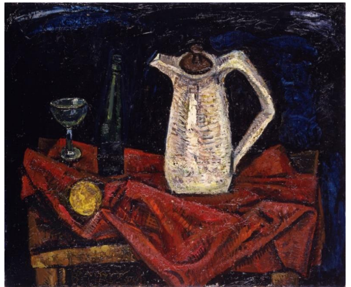
【第9章出品作品】 兵藤和男《赤い布と水差し》 1975年 油彩、カンヴァス 60.6×72.7cm