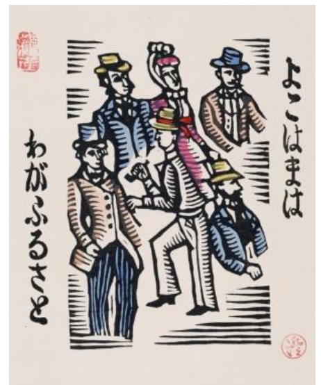
【第5章出品作品】 川上澄生 《横浜(よこはまはわがふるさと)》 1967年 木版、手彩色 26.6×20.1cm