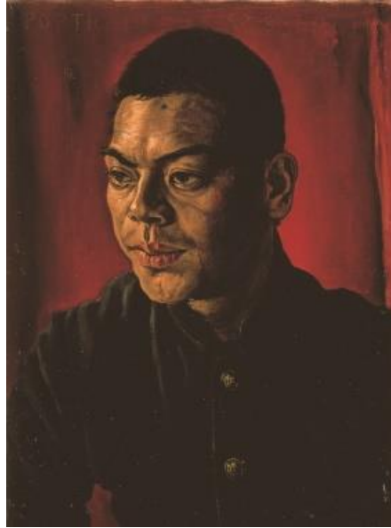
【第1章出品作品】 岸田劉生 《椿君之肖像》 1915年 油彩、カンヴァス 45.5×33.5cm