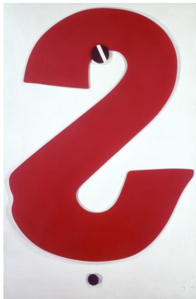
【第8章出品作品】 斎藤義重 《クレーン》 1967年 合板、ラッカー 183.0×122.0cm