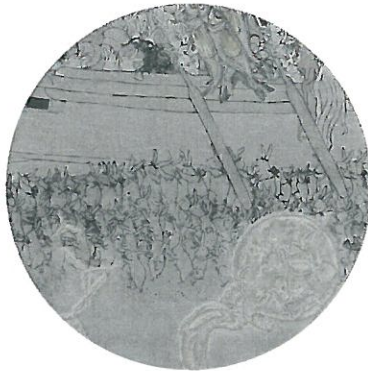
(大宝市) (部分) 2012年