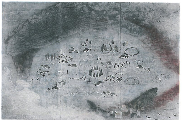
(ものおくり) 2013年 白亜地、胡粉、墨、箔、モデリングペースト、岩絵具、パネル、綿布 230×340cm