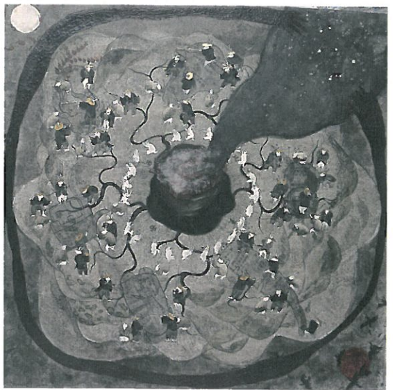
(阿仁) 2014年 白亜地、水干、岩絵具、墨、箔、モデリングペースト、パネル、綿布 115.5×115.5cm